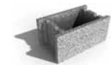
Leier beton zsaluzóelem