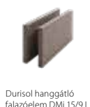
Durisol hanggátló falazóelem DMi 15/9 L