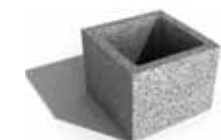
Leier beton pillérzsaluzó elem