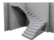
ELŐREGYÁRTOTT FALAK ÉS LÉPCSŐK