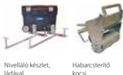
Nivelláló készlet, ládával