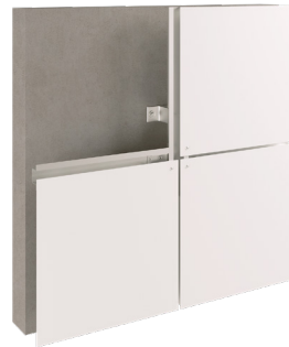
Riveted system Système de revitage

Chez Alubuild®, nous voulons apporter de nouvelles possibilités et solutions à l'architecture contemporaine. Pour ce faire, nous disposons d'une large gamme de systèmes d'assemblage qui offrent la solution la plus adaptée quel que soit le type de façade de vos projets :