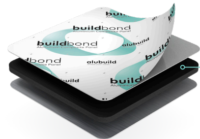
PE core Noyau PE

NOTA: Other specifications on request. NOTA: Autres spécifications sur demande.