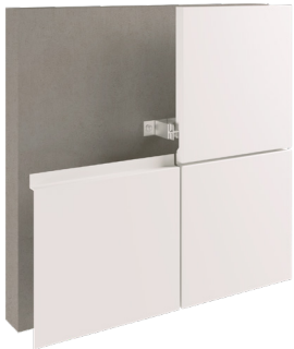
Cassette system 1 Système à cassettes 1

At Alubuild® we want to bring new possibilities and solutions to contemporary architecture. To this end, we provide a wide range of assembly systems that offer the most suitable solution whatever the type of facade of your projects: