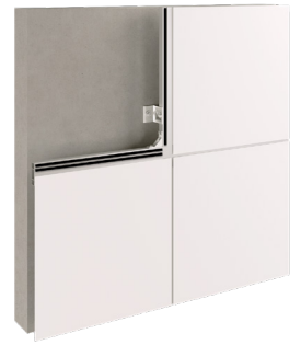
Glued system Système collé

2 Available with staples for vertical positioning. 2 Disponible avec agrafes pour un positionnement vertical.