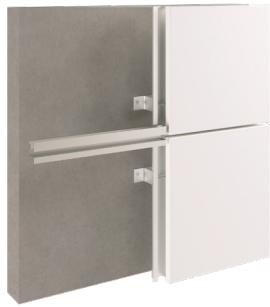
SZ system 2 Système SZ 2

1 Available with height adjustable staples. 1 Disponible avec agrafes réglables en hauteur.