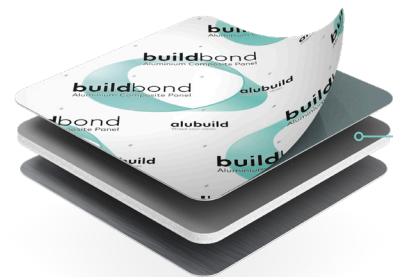
A2 mineral core Noyau minéral A2