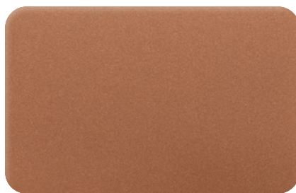
TERRACOTA cod. BB232