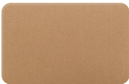
COPPER METALLIC cod. BB230