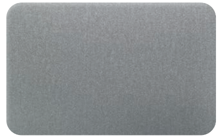
GREY METALLIC ≈ RAL 9007 | cod. BB261