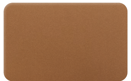
DARK COPPER METALLIC cod. BB231