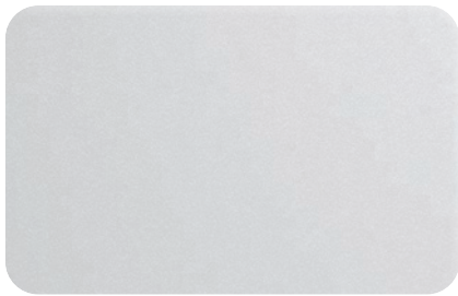
WHITE METALLIC cod. BB200