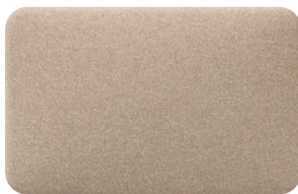
BRONZE METALLIC cod. BB264