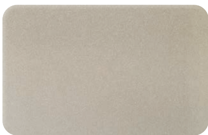
CHAMPAGNE METALLIC cod. BB263