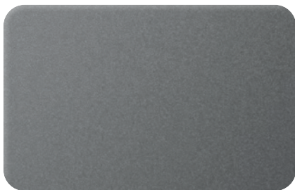
TITANIUM METALLIC cod. BB265