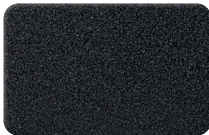
DARK GREY METALLIC cod. BB262