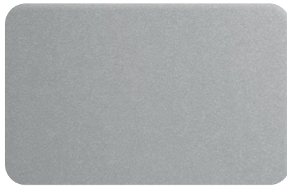
SILVER METALLIC ≈ RAL 9006 | cod. BB260