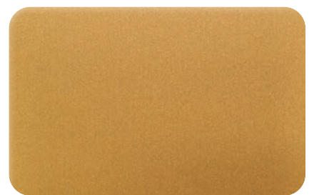
GOLD METALLIC cod. BB210